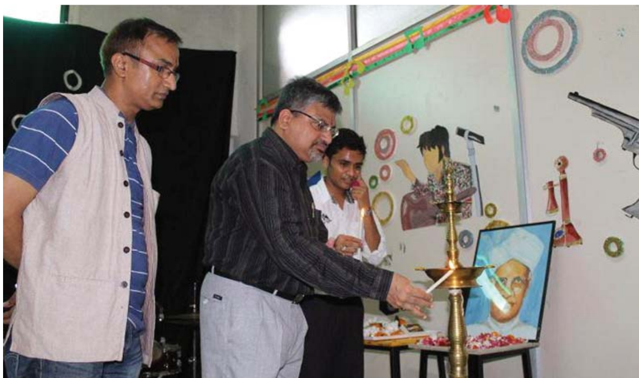
SPA Bhopal celebrates Teachers Day every year with great enthusiasm