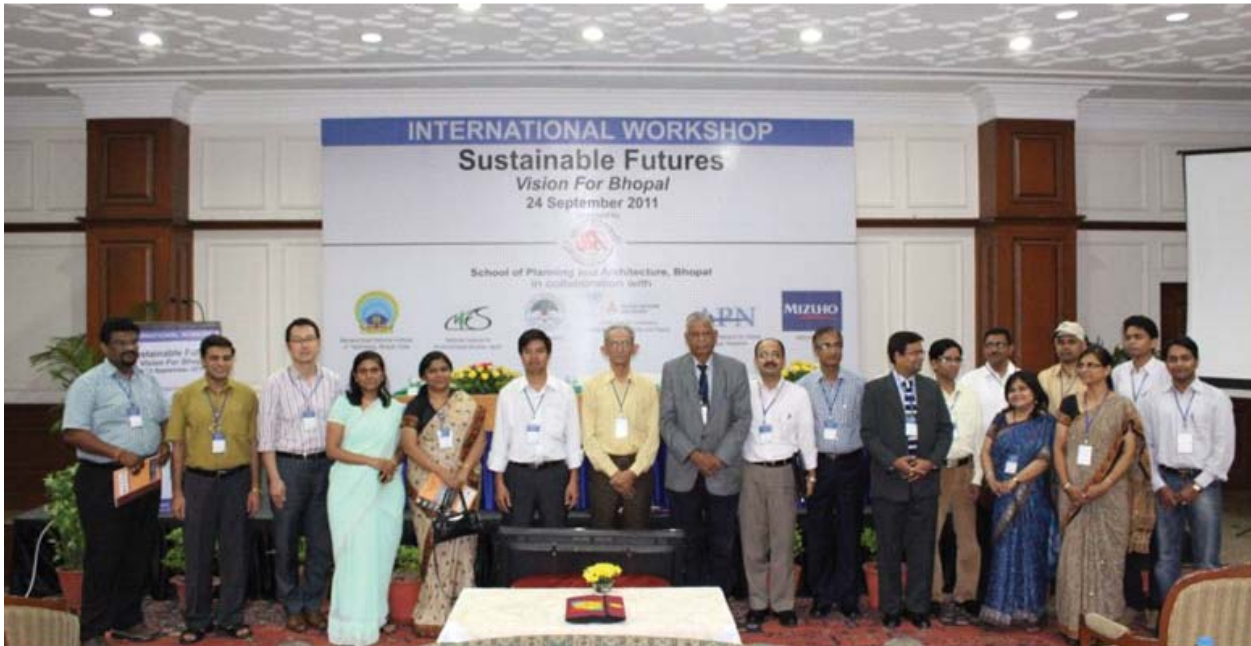
SPA organized International workshop 'Sustainable Futures' for developing 'Low Carbon Society' vision for Bhopal, 2020