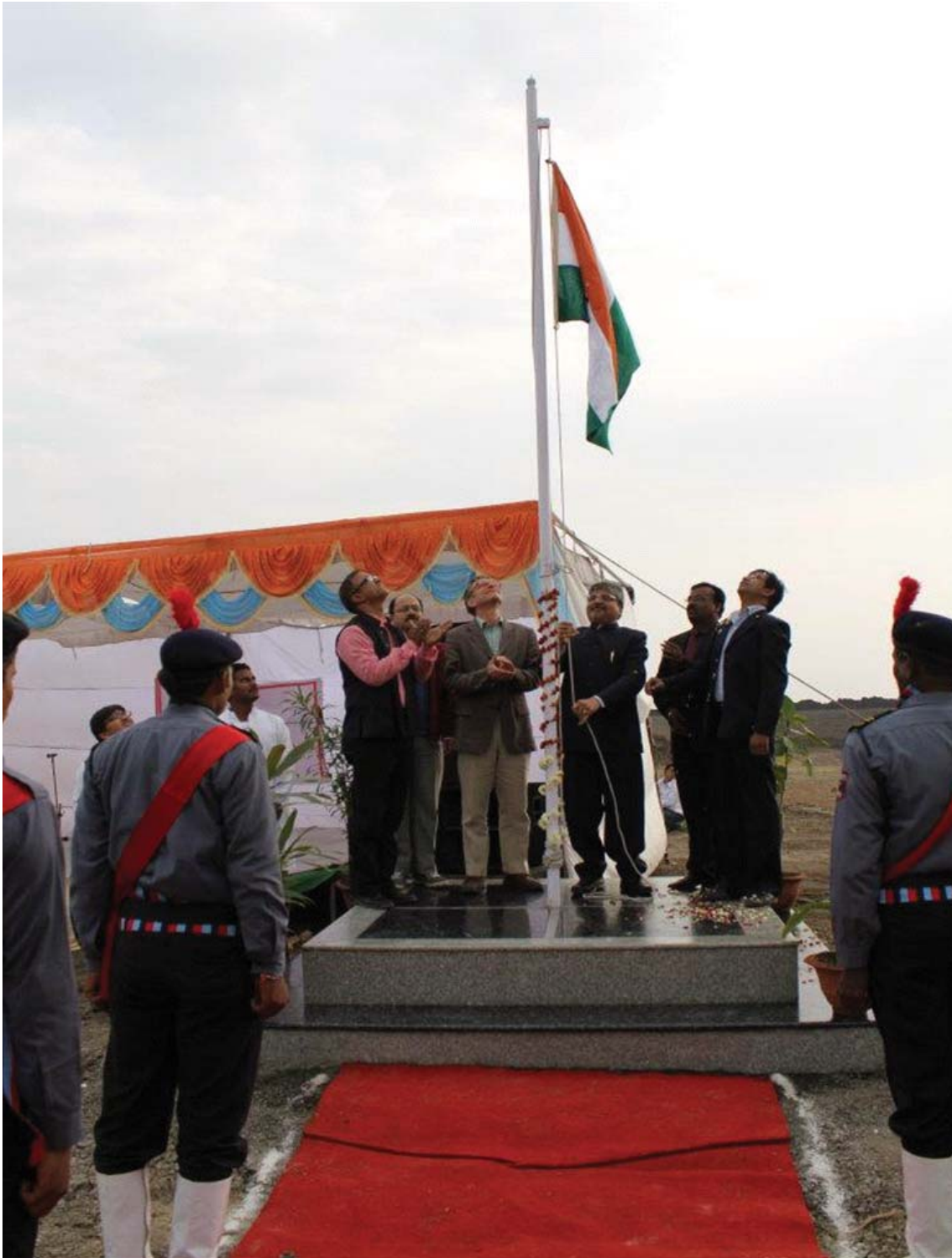
Republic Day 2012 was celebrated at Bhauri site for the first time in new campus of SPA Bhopal