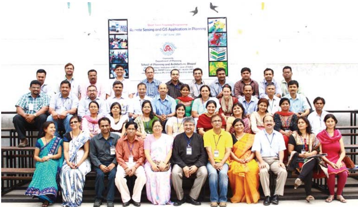
SPA Bhopal organized a series of workshop for faculty and students of colleges in India on Remote Sensing and GIS application in planning