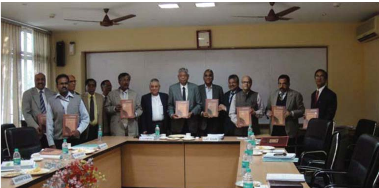
Release of 'SPANDREL' Monsoon 2011 at New Delhi by members of SPA Society