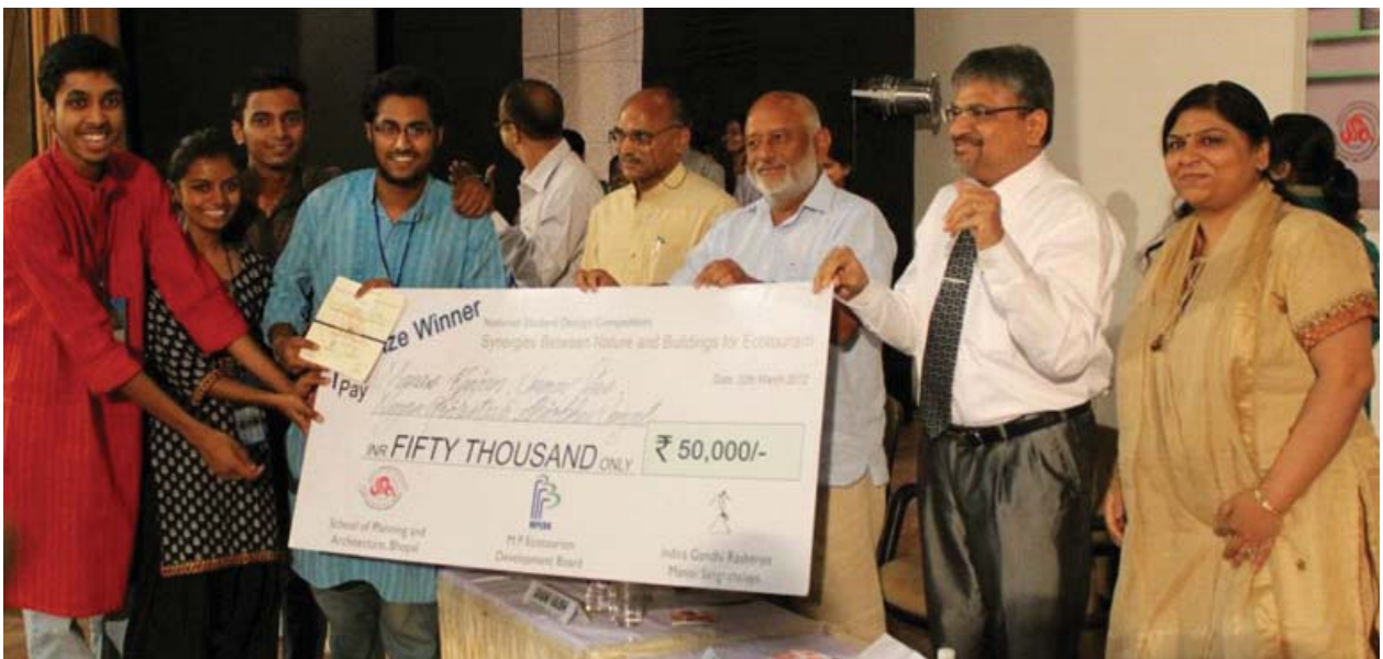
Chief Secretary of Madhya Pradesh State presented First Prize to winners of NSDC from SPA Bhopal