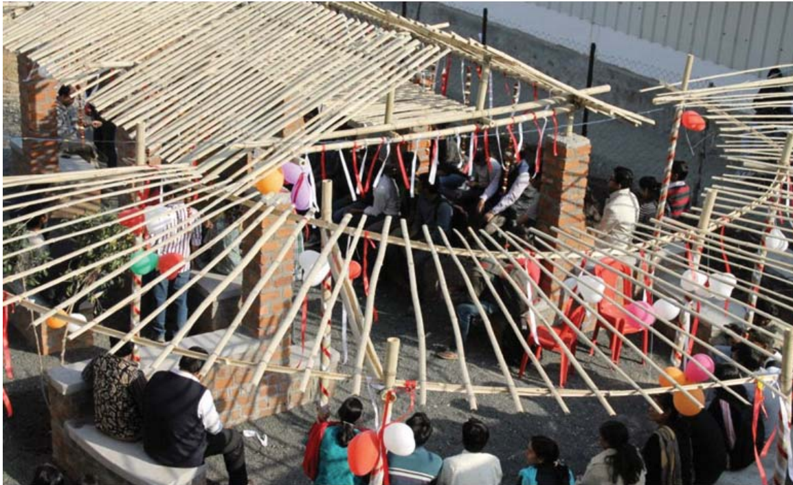
At transit campus students designed a canteen structure and constructed it themselves