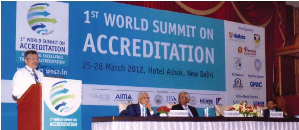
Director spoke at 1 st World Summit on Accreditation about achieving excellence in Architectural Education through Validation System