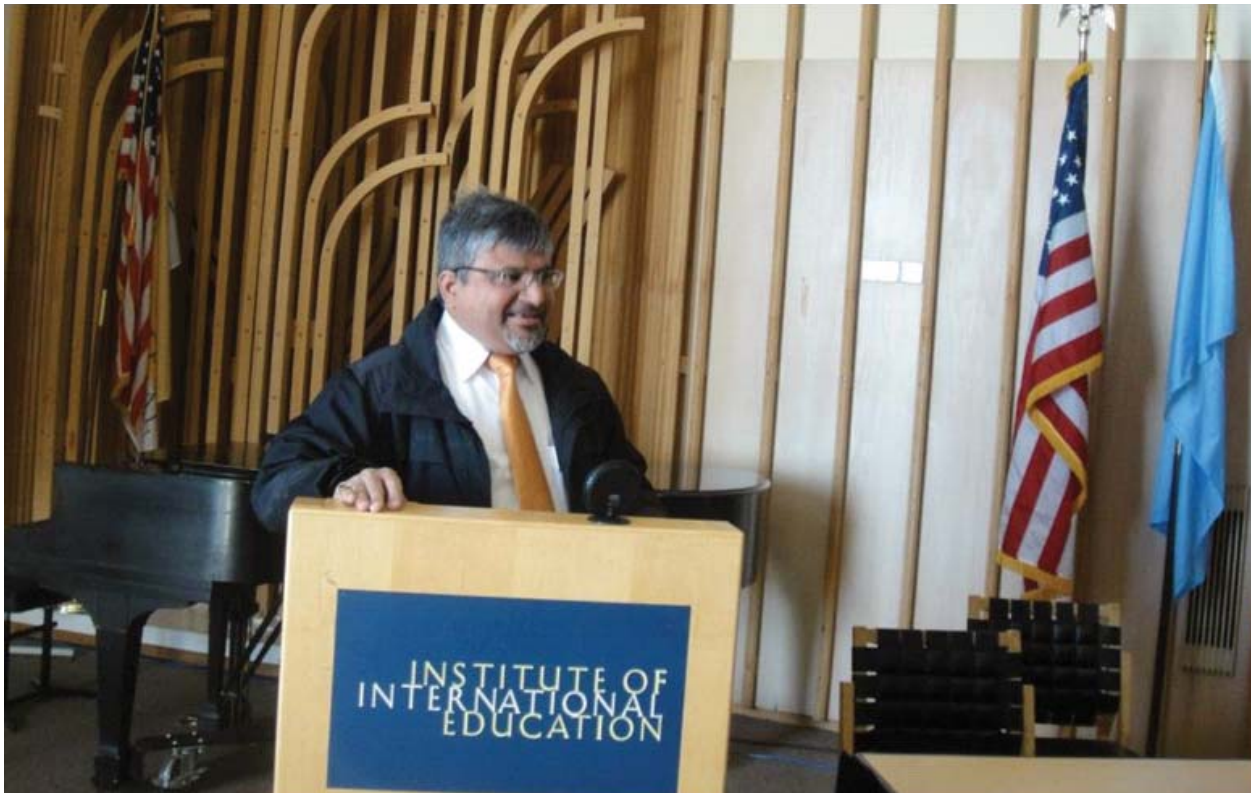
As Fulbright Fellow, Director attended a fortnight long programme in USA and spoke at IIE, New York