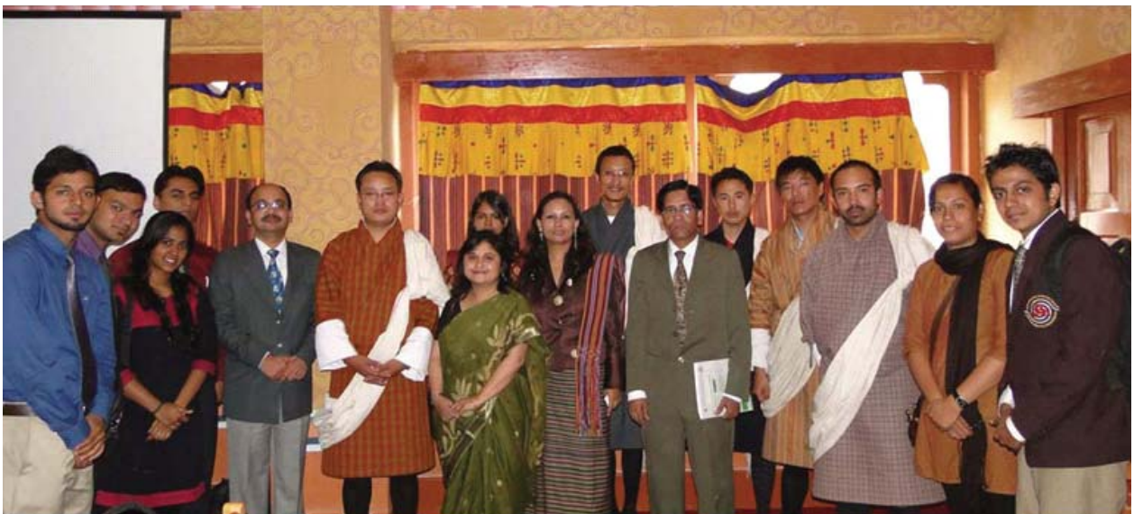
During Thimpu visit Students and Faculty interacted with senior most officials of Bhutan