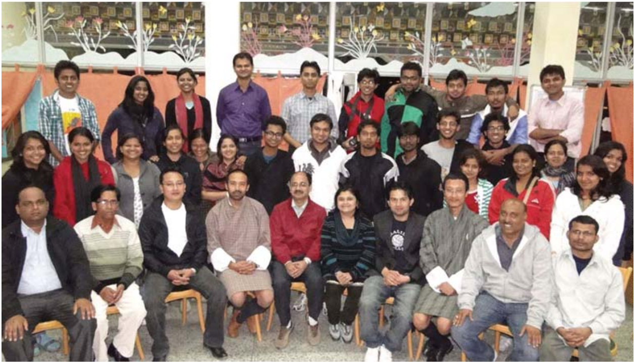
Students of Planning Programme visited Thimpu , Bhutan and prepared a Regional Plan of Thimpu