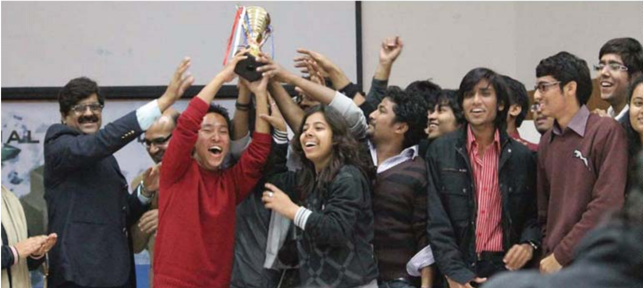
Planning students of SPA Bhopal won NOSPLAN 2011 trophy at SPA Delhi