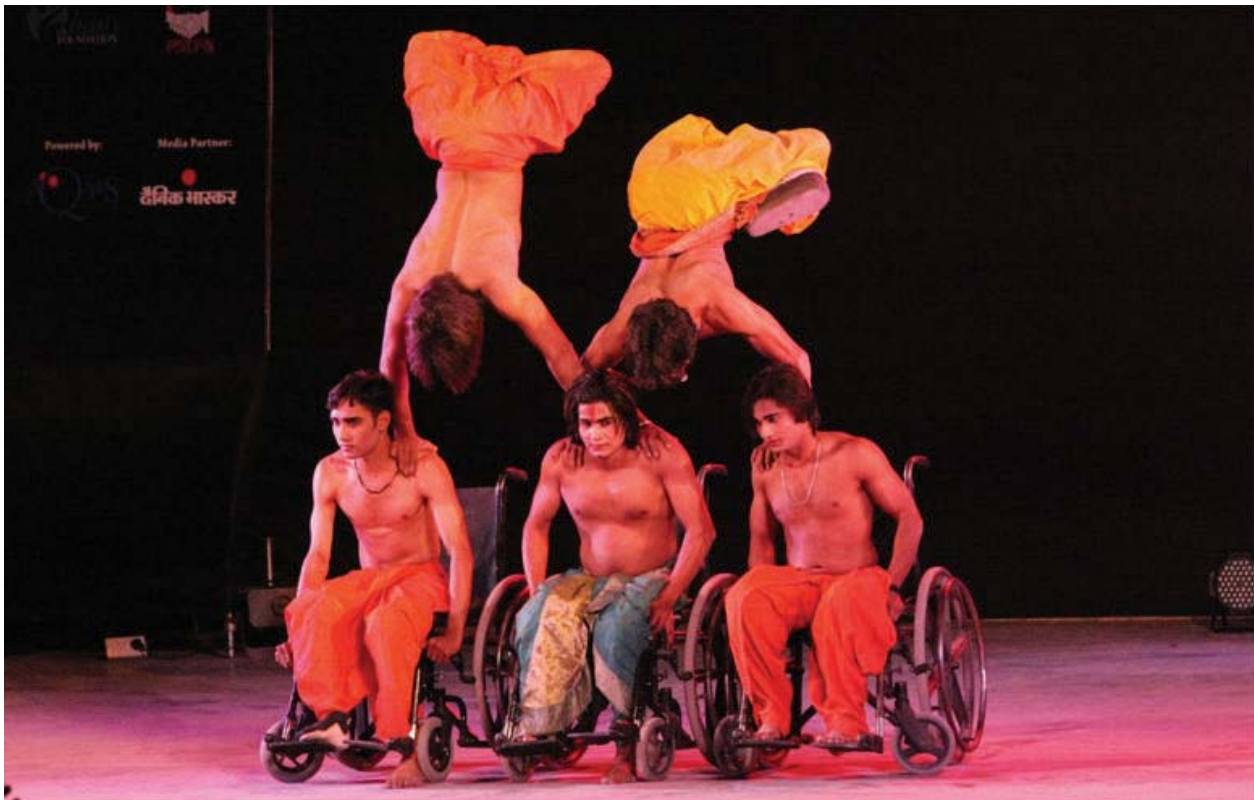
Cultural Performance "Miracle on Wheels"