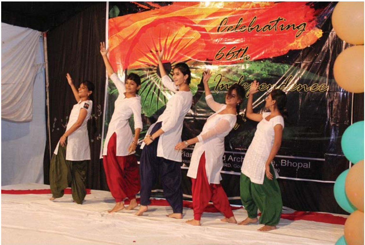
Independence Day 2012 was celebrated at SPA Bhopal