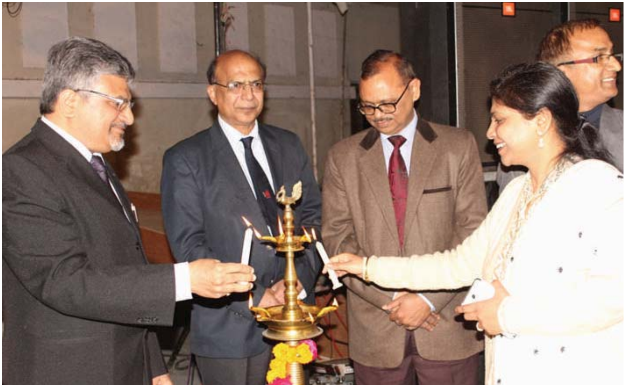
Inauguration of National Awareness Campaign