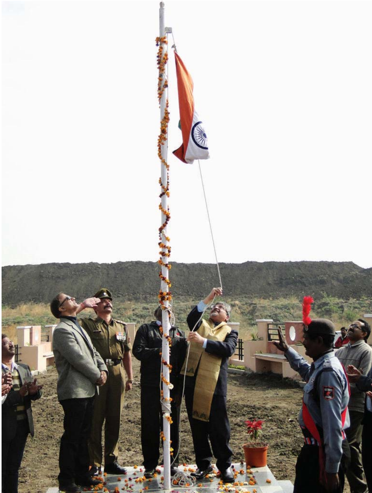
Republic Day 2013 was celebrated at Bhauri in new campus of SPA Bhopal