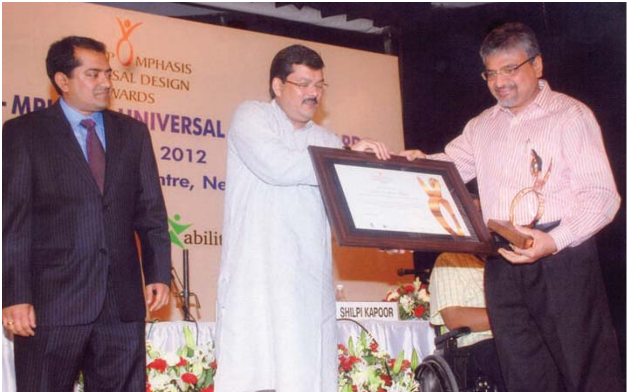
The Director of SPA Bhopal, receiving NCPEDP-MPhasiS Universal Design Award