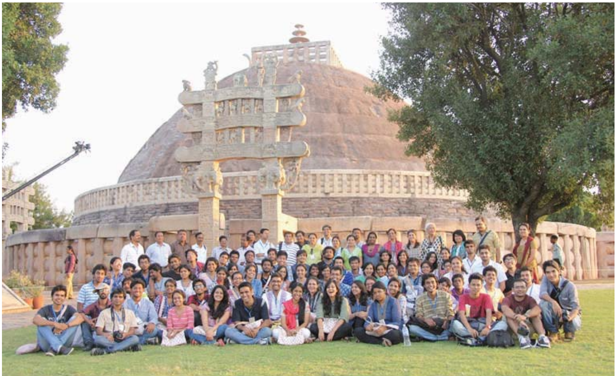
NSDC –III 'Universal Design for Exploring the World Heritage Sites in India'