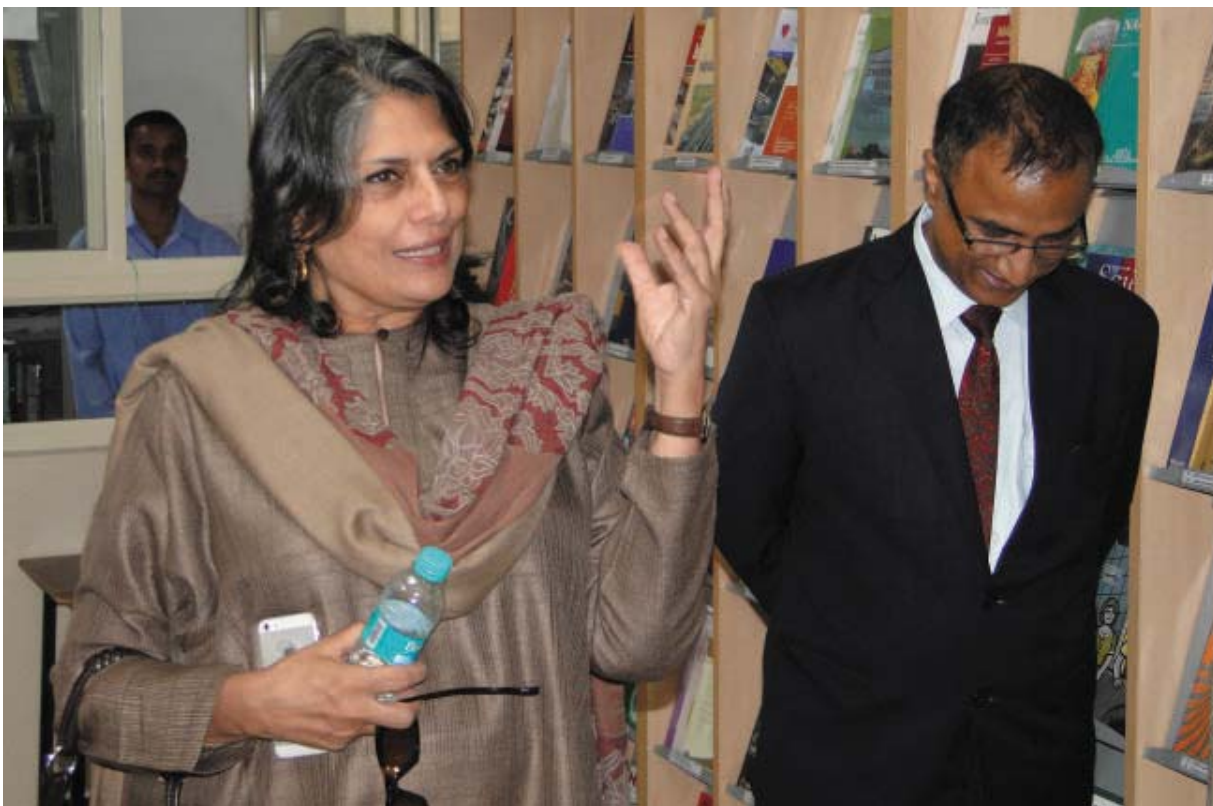
Chairperson in the Library of the Institute