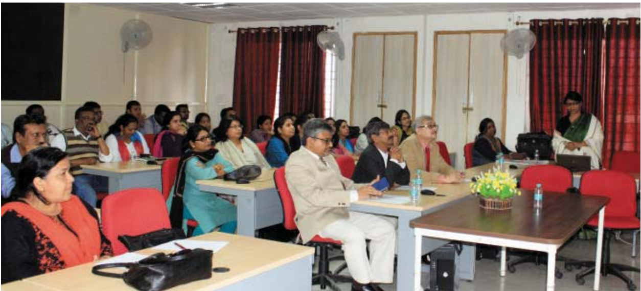
The Annual faculty forum in progress