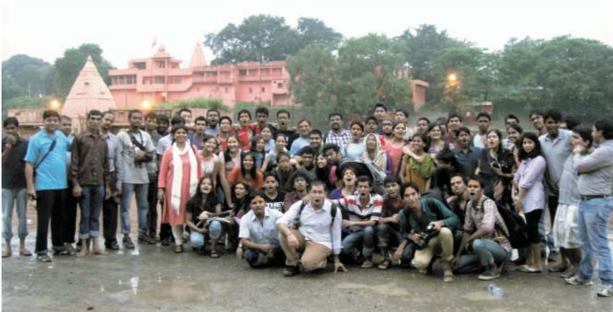
Student and faculty at Ujjain as part of their Study on Universal Design for Cultural Interface in the Sacred Site of Ujjain