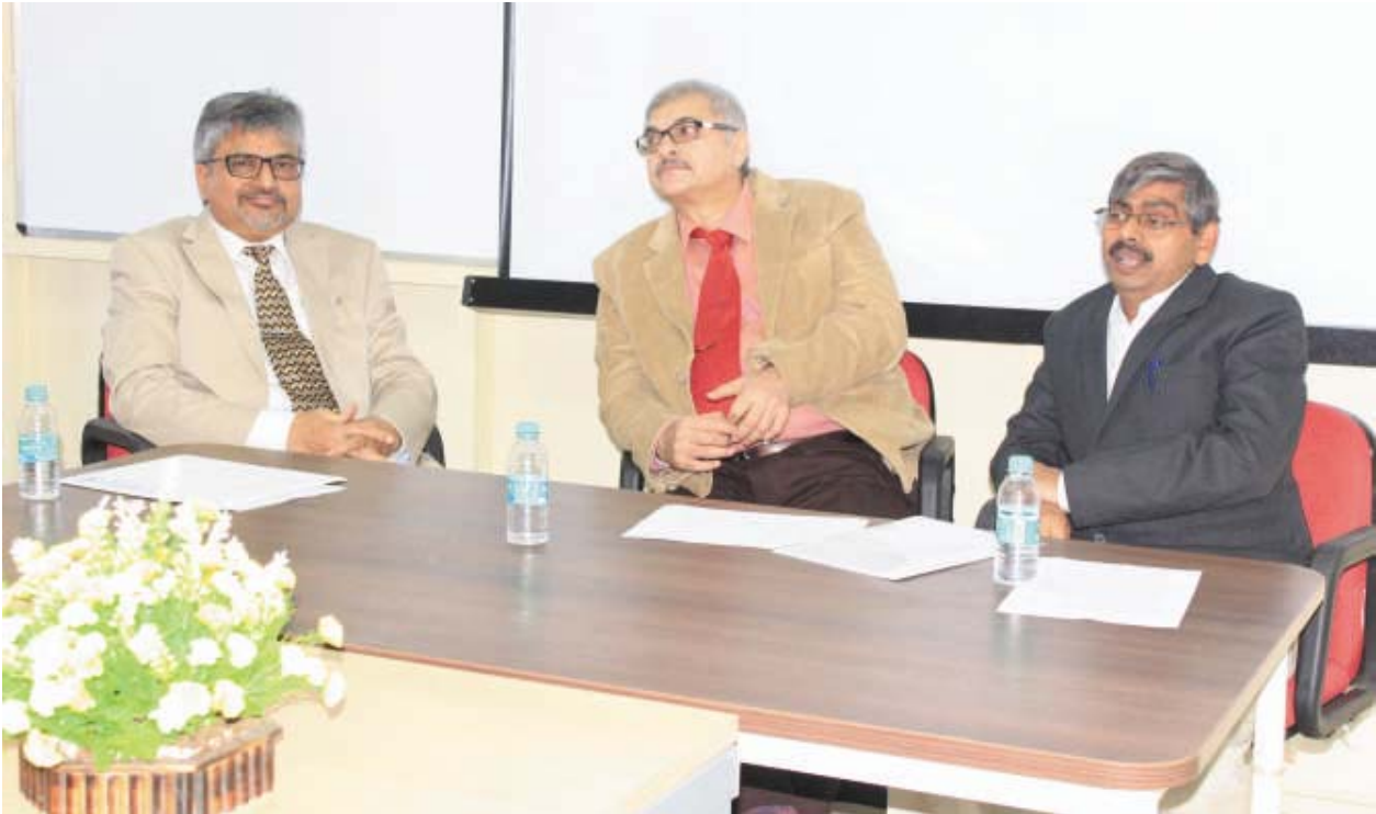
The Annual faculty forum in progress