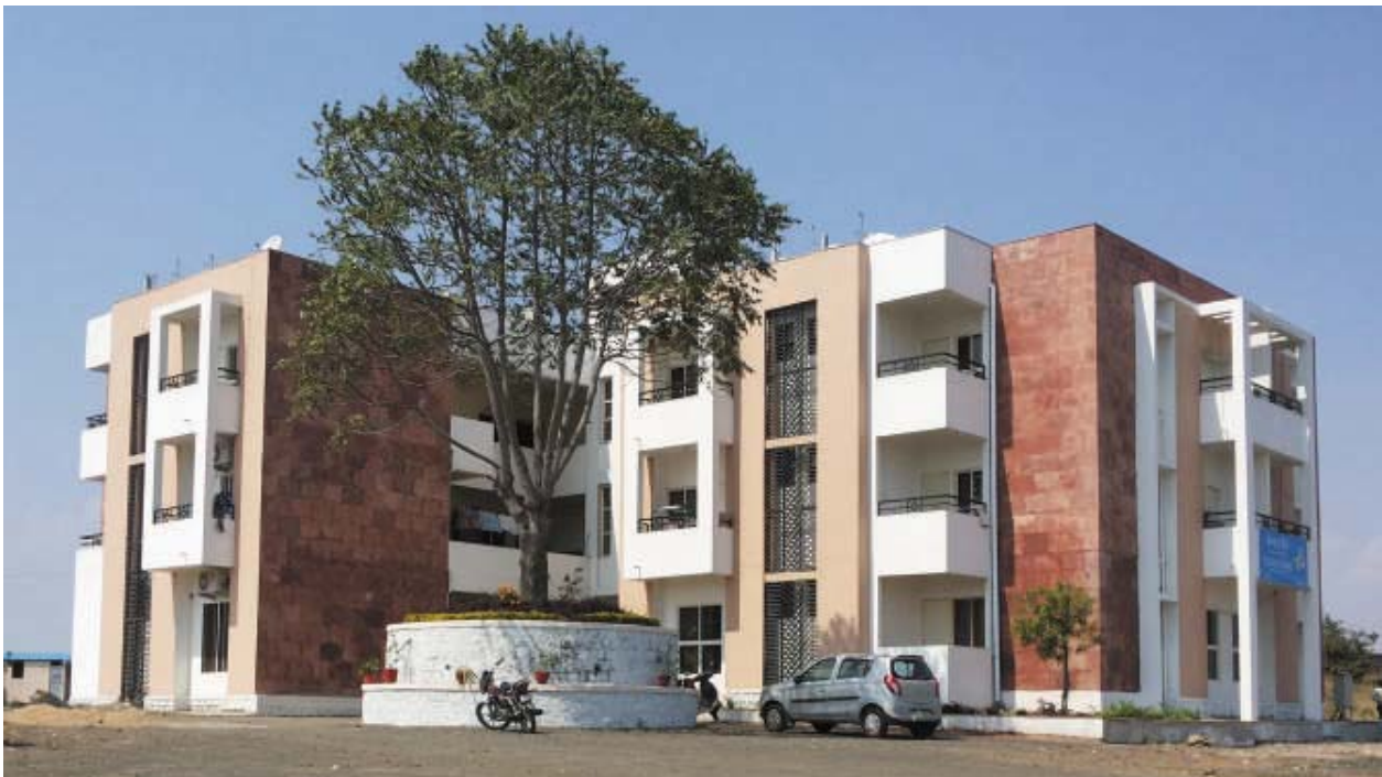
Group B Residential Block at Bhauri Campus