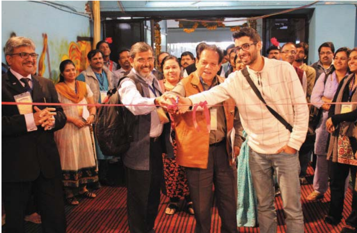
Inauguration of National Student Design Competition 2013-14