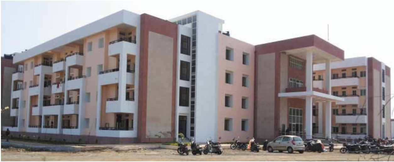
View of the Boys Hostel at teh Bhauri Campus