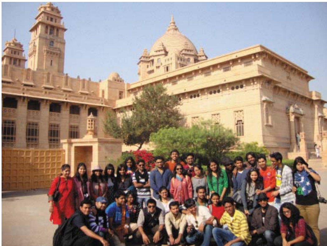
Study Tour to Rajasthan