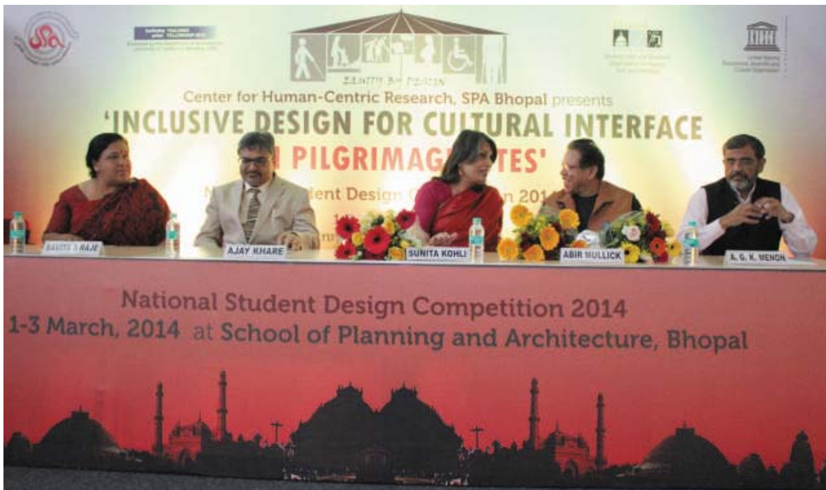
National Student Design Competition 'Inclusive Design for Cultural Interface on Pilgrimage Sites'.