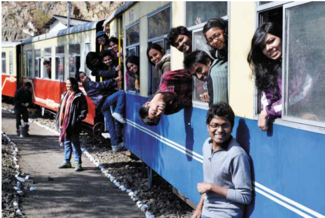
Study Tour to Himachal Pradesh